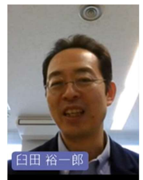
講演中のスクリーンショット